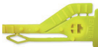
GRIP SEGUR 'POST'