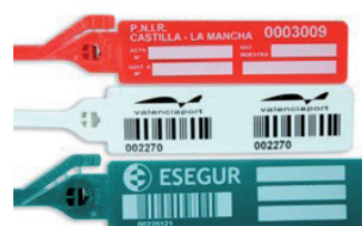
GRIP SEGUR 'POST'